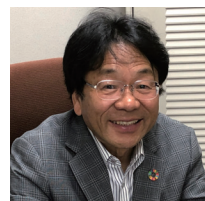
[執筆者] 北村 邦夫